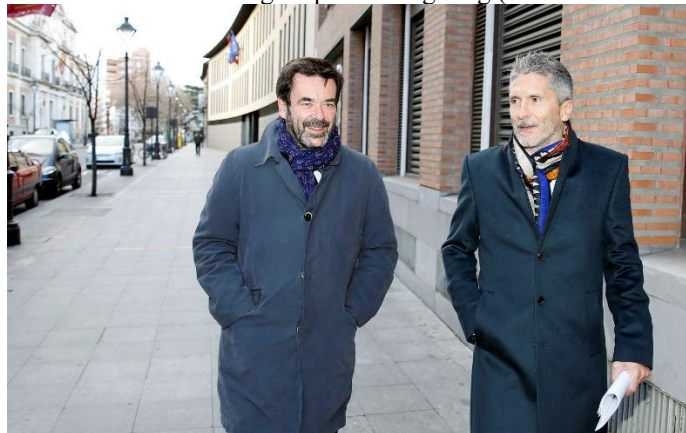
Grande Marlaska en zijn Baskische echtgenoot

Maar Bildu, de “partij van ETA” steunt de huidige Spaanse Regering (met een onthouding)