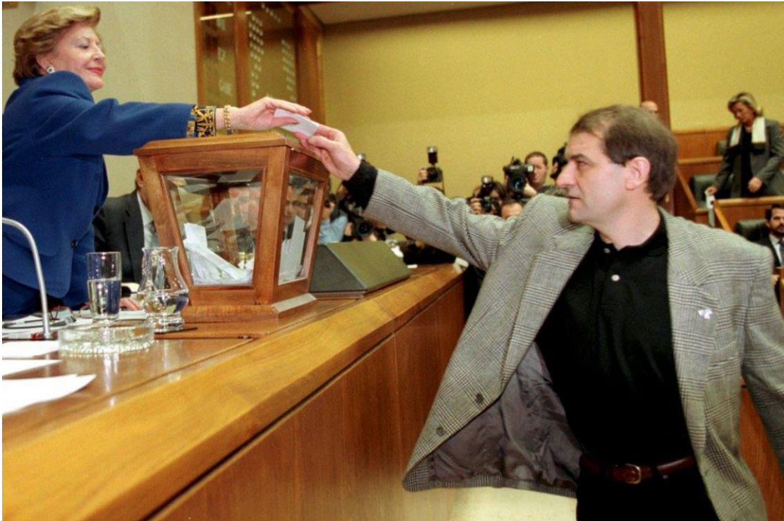
Vreemd is dat hij sedertdien verschillende jaren in het Baskisch Parlement zetelde!!! (foto)

De Spaanse Bloedraad gaat een rechtszaak openen tegen José Antonio Urrutikoetxea, “Josu Ternera”, voor een aanslag, in 1987, op de kazerne van de Guardia Civil in Zaragoza. Bij die aanslag vielen 11 doden waaronder 5 kinderen. Nadien zouden in die kazernes geen burgers meer wonen.