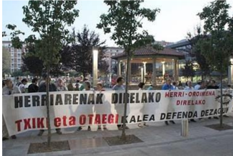
(AHAZTUAK 1936-1977 /)