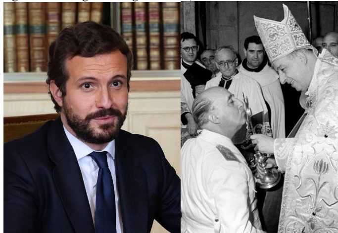
Pablo Casado en zijn grote voorbeeld, dictator Franco

Dat kost hem geen stemmen want binnen de Partido Popular is alles tot in de puntjes “geregeld”. (In het Spaans “atado y bien atado” “vastgebonden en goed vastgebonden”)