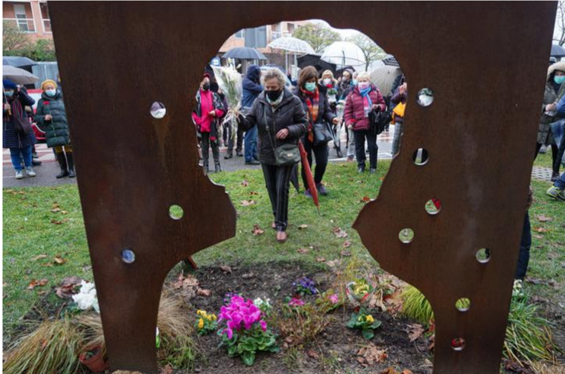
Bloemenhulde ter herinnering aan de “verdwenen” personen.

Er vielen 15 personen als verkeersslachtoffer van de gevangenesspreiding.