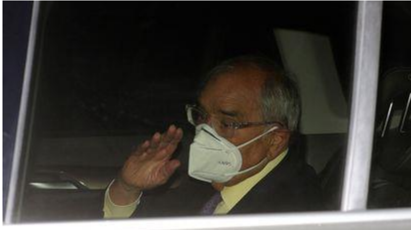
Rodolfo Martín Villa toen hij in september 2020 de Argentijnse Ambassade in Madrid verliet.