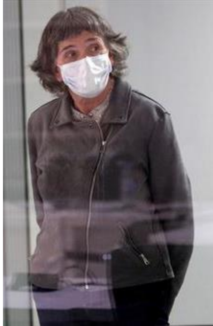
De “historische” ex-dirigente van ETA, Marisol Iparragirre.

15.11.21 Marisol Iparragirre “Anboto” aanvaardt de gevangenisstraf van 15 jaar door de Spaanse Bloedraad Het Spaanse Gerecht maakte duidelijk dat, ondanks de bekentenis, de strafeis niet verlaagd kon worden omdat ze al tot de laagst mogelijke sanctie in de Strafwet veroordeeld werd. Iparragirre was eerder al akkoord gegaan met deze strafeis.