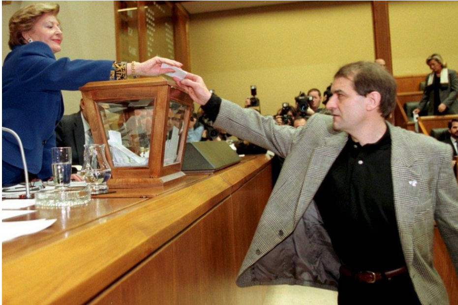
Josu Urrutikoetxea bij een stemming in het Baskisch Parlement

In 1987 werd een ETA-aanslag gepleegd op de kazerne van de Guardia Civil in Zaragoza, Spanje, 34 jaar geleden! Omdat er kinderen en hun moeders doodbleven werden vanaf dan geen families meer ondergebracht in die kazernes. Voor deze aanslag werd Josu Urrutikoetxea verantwoordelijk gesteld. Josu Urrutikoetxea kwam de voorbije zomer vanuit Parijs terug naar Lapurdi in Noordelijk (“Frans”) Baskenland. Nu zou hij moeten terechtstaan voor de eerste aanslag waarvan hij beschuldigd wordt/werd. In 1987! Vreemd dat hij tussendoor verschillende jaren in het Baskisch Parlement zetelde!!!