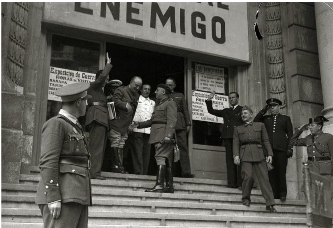
Franco, bij een bezoek aan Donostia - San Sebastian in 1939.

24.11.21 Het Baskisch Parlement (*) vraagt een verslag van de plunderingen door het Francoregime. (* behalve de neofascisten van PP + Ciudadanos en Vox)