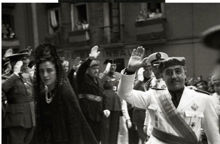
De voormalige minister (L) en de bende van Franco, op bezoek in San Sebastian

De vraag werd nu al voor de derde keer gesteld maar het PNV-PSE bestuur blijft bij de laat-maar-waaienmentaliteit en verzet geen poot!