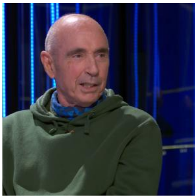
Lluís Llach

Ook nu is hij weer erg “scherp”: “ We leven in een koloniale Staat. Waarvoor dient onze autonomie nog? ”