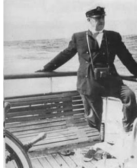
Francisco Franco als zeeman!

Aan het roer stond Francisco Franco, van beroep Spaans Dictator! De twee toenmalige kranten maakten melding van het gebeuren maar niet van de stuurman!