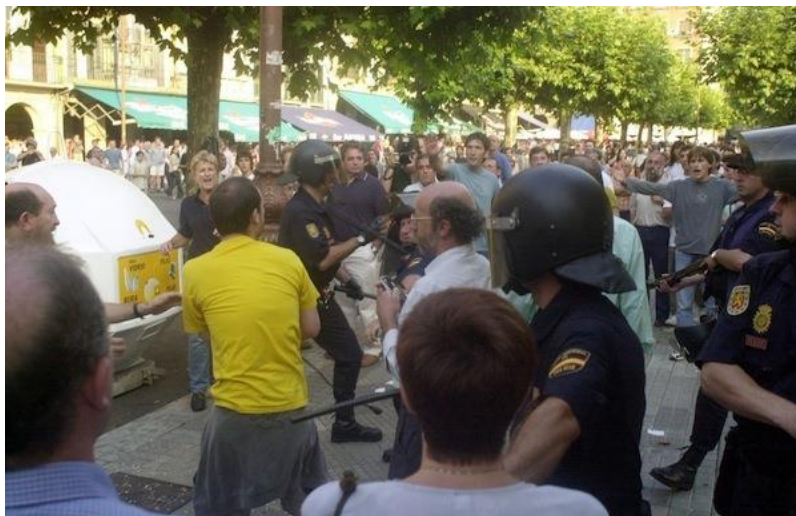
Ook moeten er bomen verwijderd worden. Let op de wapenstok waar de politiemannen zich steeds aan vasthouden.