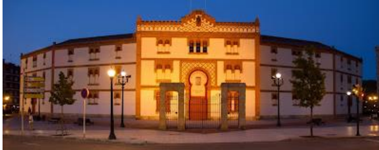
De Plaza de Toros van Gijón