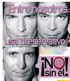
Minister Grande Marlaska (L) en (rechts beneden) op de publiciteit voor het gebruik van condooms

Fernando Grande Marlaska was in een vorig leven onderzoeksrechter en opvallend vaak werd geklaagd dat Baskische politieke gevangenen die onder zijn bevel gearresteerd werden bijna allemaal stevig gefolterd werden. Spanje werd, vóór Marlaska minister van Binnenlandse Zaken was , door het Europees Tribunaal voor de Mensenrechten 10 maal veroordeeld voor het niet onderzoeken van klachten van foltering . Bij die 10 klachten was Marlaska 7 keren onderzoeksrechter . Er werd gefluisterd dat hij op die foltersessies aanwezig was. Marlaska maakte ook “publiciteit” voor het gebruik van een condoom bij seks onder mannen.