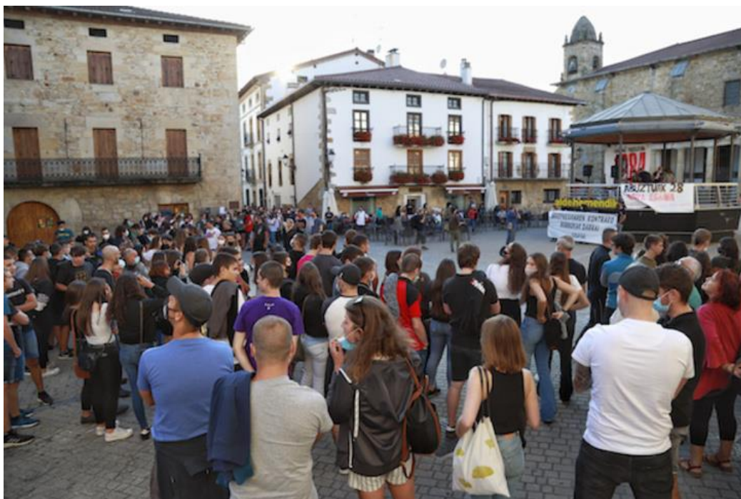
Ospa Eguna OPROT - DAG in Altsasu.

Op de 10de Oprot-Dag, gisteren, werd opnieuw geëist dat de bezettende macht terug naar Spanje gaat en dat de repressie moet stoppen.