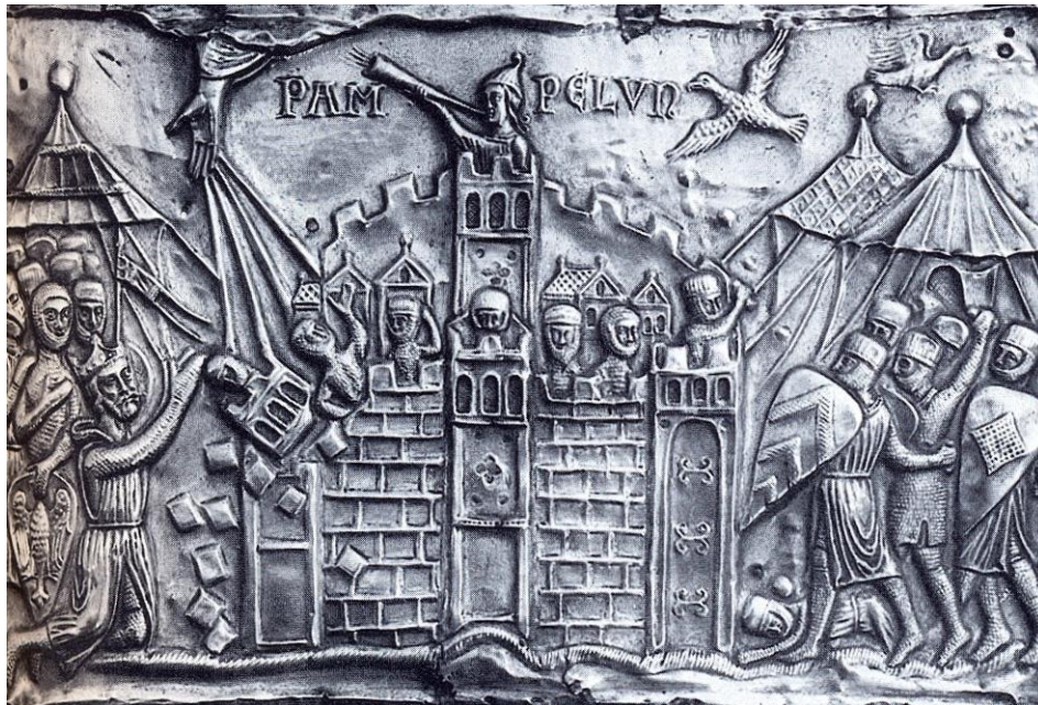
Sarcofaag met de stoffelijke resten in de Dom van Aken. Karel de Grote (L) die de muren van “Pampelvn” omver trekt

Vrijdag (Iruñea) en zondag (Orreaga) zullen de Basken de Veldslag van 778 herdenken. In dat jaar kwam Karel de Grote, onze “Carlomagno”, voorbij nadat hij “Cesaraugusta” (Zaragoza) kwam bijstaan om de Moren te verjagen die de stad aanvielen. Mogelijk mochten de troepen hun soldij bij elkaar vechten in Pamplona maar ze trokken ook de stadsmuren om waardoor de stad onverdedigbaar achterbleef. De Basken zonnen op wraak en boven het klooster van Roncesvalles isoleerden ze met wat rotsblokken de achterhoede van het Christelijke Leger, onder bevel van Roeland, en “hakten het in de pan”. In het Roelandslied wordt dit omschreven als een nederlaag tegen een “ Enorm Moors Leger ”.