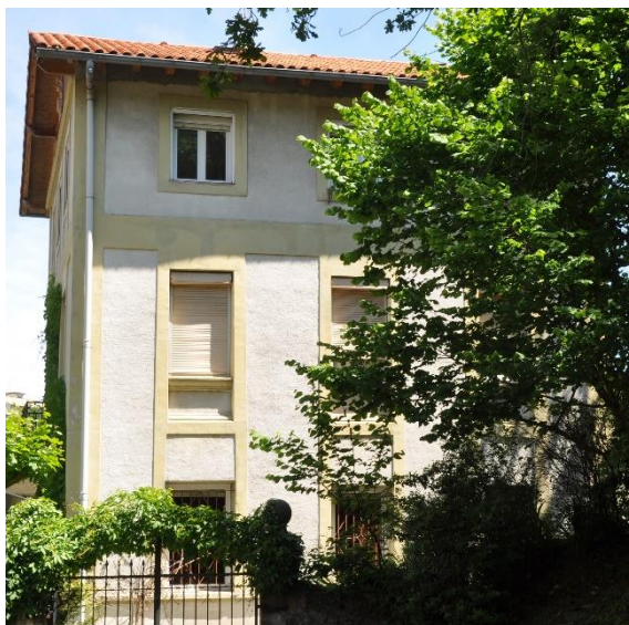
“Tolaretxea” of “Tolaretxe

Het Antiterrorisme – “elite-peloton” van de Guardia Civil viel om 4 uur ’s nachts de woning, “Tolaretxea”, aan en die aanval duurde tot 9 uur ’s morgens.