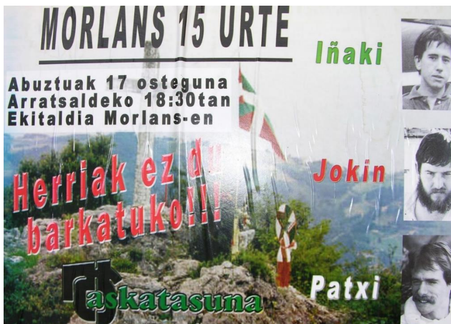
Herdenking in Morlans, 15 jaar later.

Toen het drietal jaren later herdacht werd, op 17 augustus 2006, trad de (Baskische) politie, Ertzaina opnieuw op. Ze namen de foto's weg!