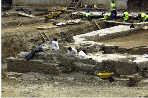
Enkel de oude stadsmuren worden niet verwijderd

Het centrale plein van Pamplona werd jaren geleden vrijwel verkeersvrij gemaakt. Nu wordt het archeologisch patrimonium weggehaald om er, ondergronds, auto's in de plaats te zetten. Nochtans kwam er enkele jaren geleden vlakbij al een nieuwe zéér grote en erg goedkope deels ondergrondse parkeergelegenheid.