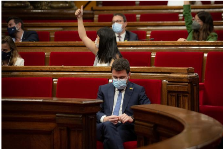
Catalaans President, Pere Aragonès, ziet de bui al hangen

30.09.21 De Catalaanse Partijen ERC, JxCat en CUP bereiken geen akkoord over een referendum.