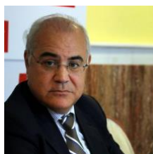
Rechter Pablo Llarena

Hetzelfde plan wordt altijd herhaald: detentie, euforie in Madrid, gerechtelijke tegenslagen en politieke nederlaag.