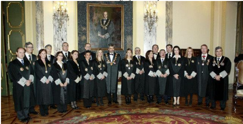
Als ze op TV komen hangen ze vol decoraties.

Deze Algemene Raad is het bestuursorgaan van de rechterlijkemacht in Spanje en voert het bestuur en behandelt interne zaken en personeelszaken. Ze blokkeren die mogelijkheid al 8 jaar. Verder doen ze niets