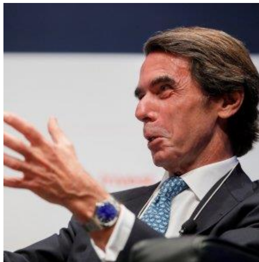
José María Aznar op het IVde Congres CEAPI ¡Wat een knapperd!

21.05.21 Aznar adviseert de Politieke Gevangenen dat wie de eenheid van Spanje aanvalt daarvoor zal betalen!