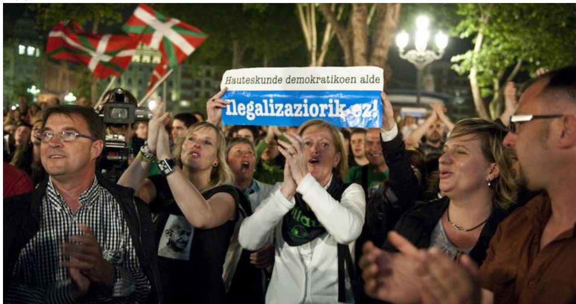
De vreugde in de nacht dat Bildu geboren werd.

Het enige verschil met vroeger was dat de Geheime politie hen niet meer achtervolgde...Enkel nog in de gaten hield.