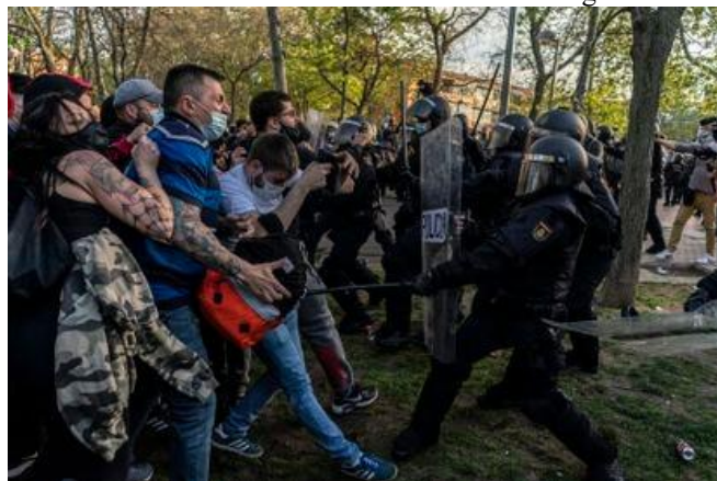
Het kiesvee van Vox