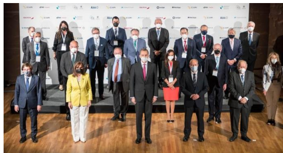
Koning Felipe VI kwam het Congres sluiten.

Hij bekritiseerde natuurlijk de huidige Regering in Madrid en hij zag dat van die immigranten in Ceuta natuurlijk allemaal “al lang aankomen”.