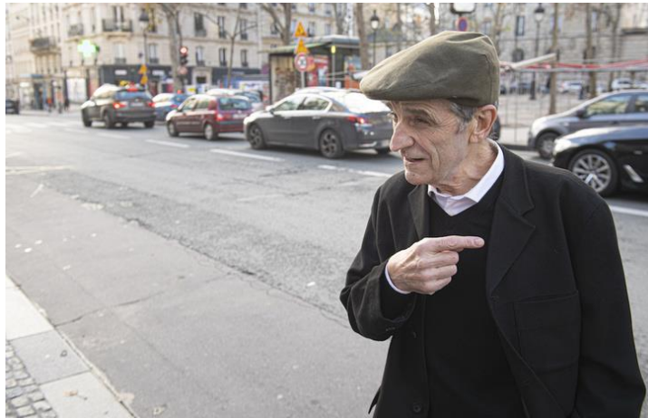
Josu Ternera in Parijs december II.

Madrid heeft wel een probleem: Ternera is in Frankrijk en die leveren hem niet uit, al was het maar omdat de huidige vrede er dankzij hem kwam. De straf die hij in Frankrijk opliep, in 2010 en 2017, gaat niet meer opnieuw opgerakeld worden.