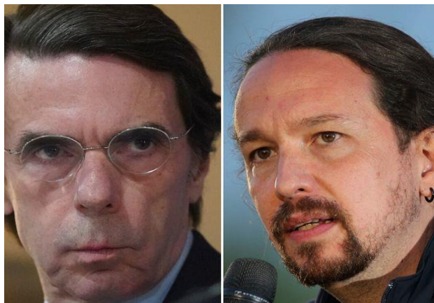
José María Aznar en Pablo Iglesias.

Voormalig President van Spanje, de Nar Aznar, roept juichend op “de krachten van uiterst rechts te verenigen”. Hij doet dit naar aanleiding van de verkiezingsoverwinning van Isabel Díaz Ayuso de voorbije 4 de mei en nadat Iglesias de politiek verliet.