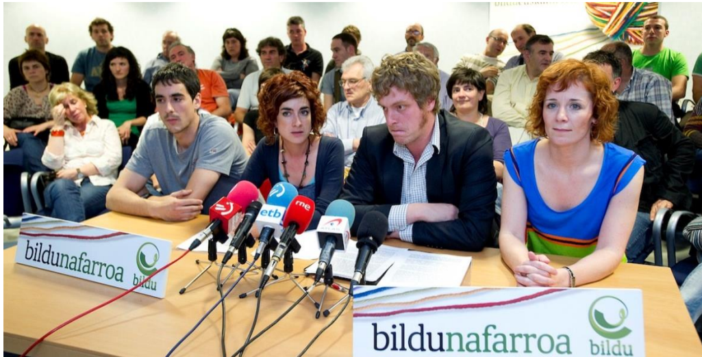
Bildu Navarra: de krampachtige trek van bezorgdheid was duidelijk.

“Bildu” werd “EH Bildu” (“Euskal Herria Bouwen”). Alles moest klaar zijn voor de regionale en de gemeenteraadsverkiezingen van 2011. En dan bleef het wachten op de beslissing van het Grondwettelijk Hof. Drie Partijen, EA, Aralar en Alternatiba waren “legaal”. Maar als het Hof ook maar één “politiek bevuild” persoon op de lijst vond kon alles in duigen vallen!