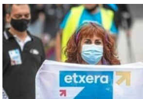
“Etxera” – “Naar huis”

Nu zullen er 25 gevangenen in Baskenland ondergebracht worden. Het maakt (voorlopig?) slechts 15 % uit maar het is een begin.