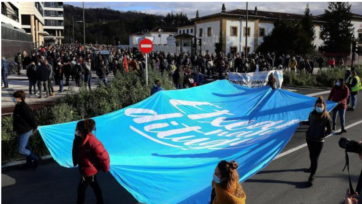
Vóór de gevangenis van Martutene (San Sebastian)