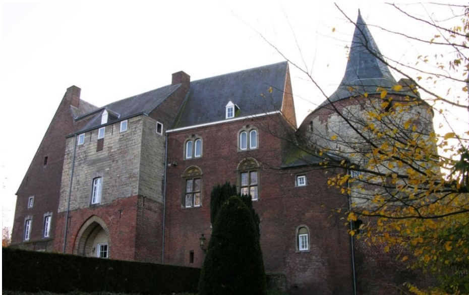
Het optrekje van de Hertog van Horn zoals het er nu bijligt

In 1546 benoemde keizer Karel V hem tot landvoogd en dit leidde tot een verschrikkelijke moordpartij. Met de terechtstelling van Egmont en Hoorn verloor de Heer die toen regeerde over mijn streek het leven!