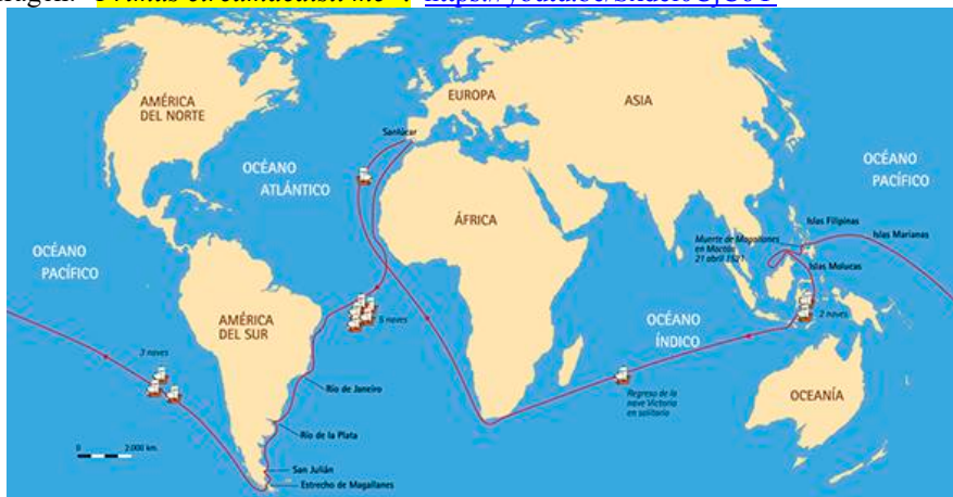
Kaart: Universidad de Cantabria (CC BY-NC-SA)

Ze werden na afloop in Valladolid ontvangen door Karel V die Elkano 500 goud-dukatens schonk en het motto dat hij mocht dragen: “ Primus circumdedisti me ”. https://youtu.be/Sxdel0CjC6Y