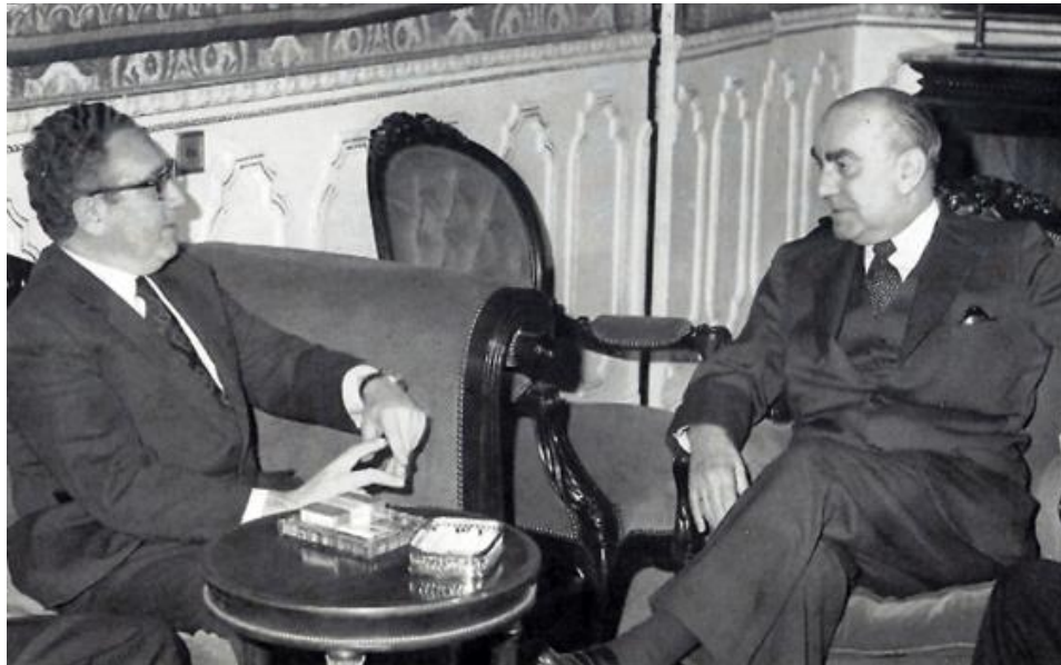
Carrero Blanco in gesprek met Kissinger. Kort nadien was hij dood!

Pas in 2008 raakte bekend dat na deze ontmoeting van 1973 de Amerikaanse Ambassade in Madrid een bericht had gestuurd: