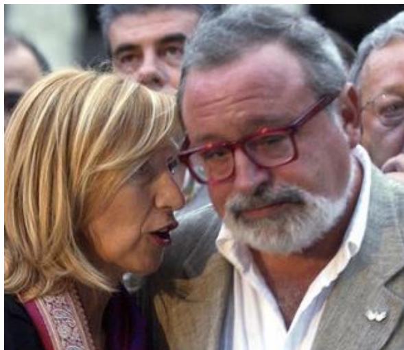
Rosa (mecaguen) Díez en Fernando Savater

Rosa Díez die van 1977 tot 2007 Baskische Socialiste binnen de PSOE was en van 2007 tot 2016 neo-fasciste in de partij UPyD laat definitief de politieke rolluiken naar beneden.