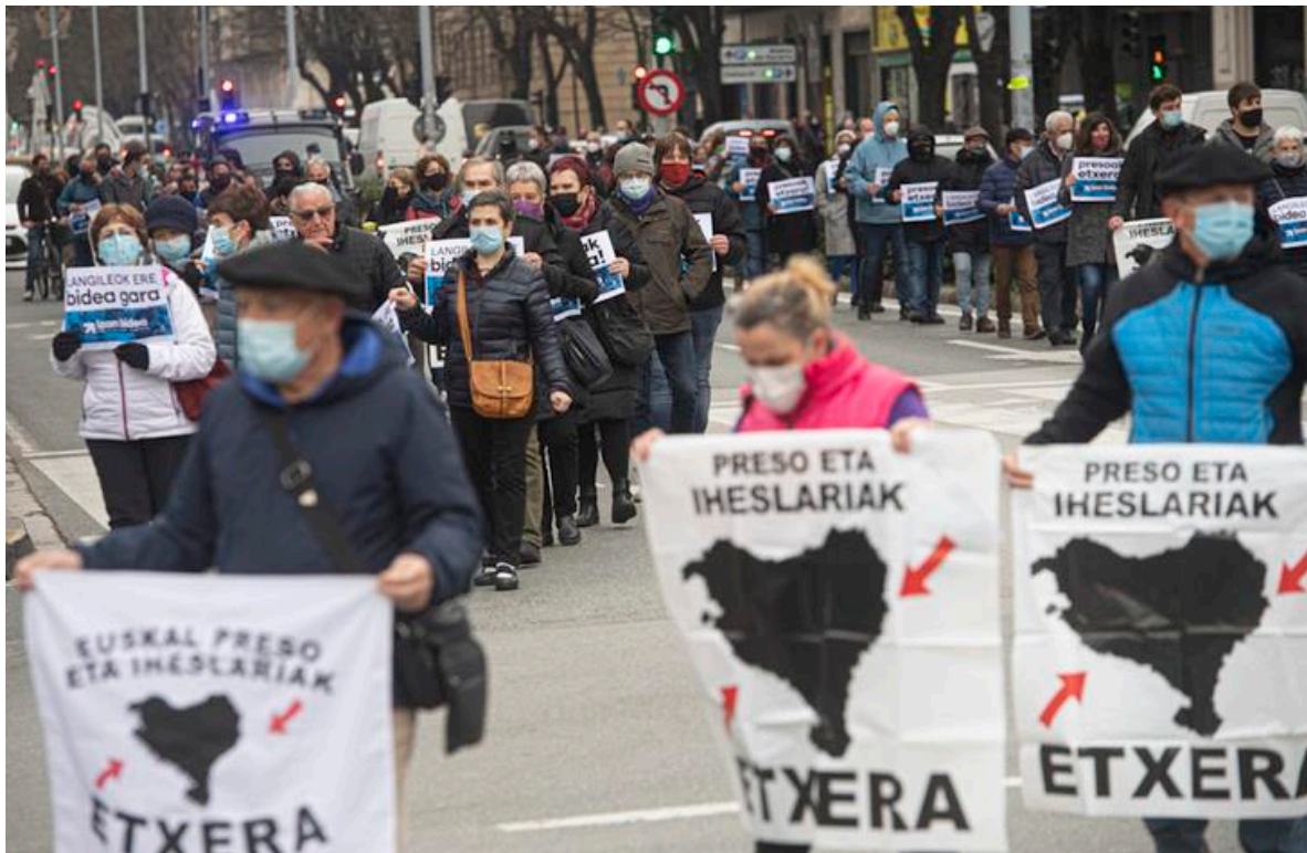
Manifestatie in Iruñea-Pamplona voor het dichterbij brengen van politieke gevangenen.

30.12.20 Zou de verhuis van politieke gevangenen naar Baskenland een gevolg zijn van dit: