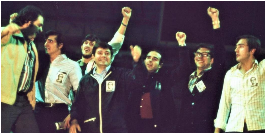
Eigen foto bij de ontvangst in de velodroom in Donostia - San Sebastian.

Vijf van de “Burgos Six” (foto) 1, 4, 5 en 6 toen ze op 29 juli 1977 eindelijk weer in Baskenland kwamen.