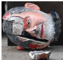
“Leve de Volkeren “