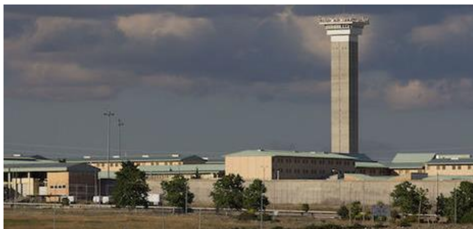
Soto del Real.