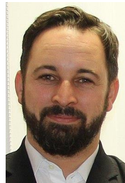
Santiago Abascal (VOX)

Uiteindelijk bleef VOX als enige achter de motie tegen de Regering Sánchez staan.