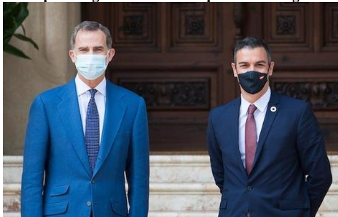
Felipe de Borbón en Pedro Sánchez samen naar Barcelona.

Het is dan ook al de derde opeenvolgende Catalaanse president die geschorst werd door Madrid.