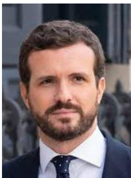
Pablo Casado (PP)

Abascal van Vox wilde het in het Spaanse Congres tot een Motie van Wantrouwen brengen tegen Premier Pedro Sánchez. Maar blijkbaar was er een haar in de rechtse boter: Casado begon tijdens zijn toespraak Abascal verbaal aan te vallen!