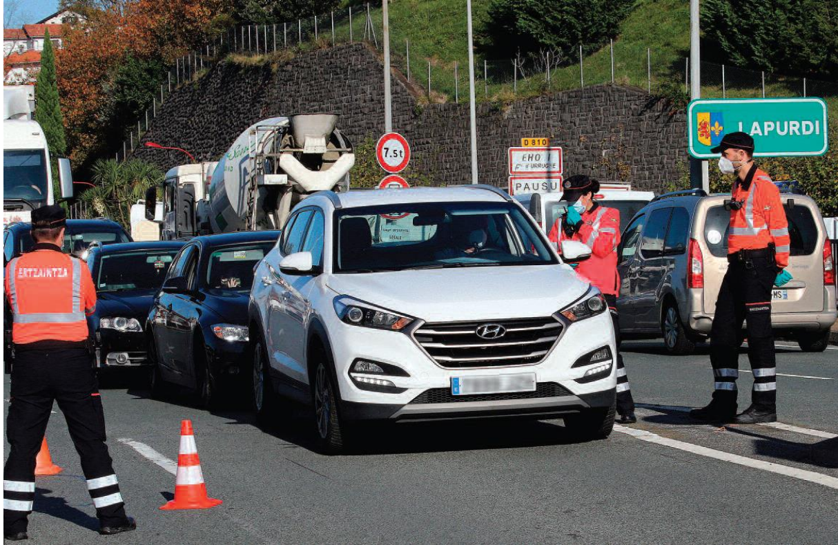
GARA frontpagina 31.10.20

31.10.20 In Lapurdi Labourd aan de “Staatsgrens” wordt nu toezicht gehouden door de Baskische Ertzaintza Aan de “streep” tussen Noord- en Zuid-Baskenland staat de Baskische Ertzaintza te controleren wie een nieuwe versie van de SPAANSE GRIEP heeft.