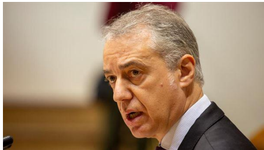
Iñigo Urkullu.