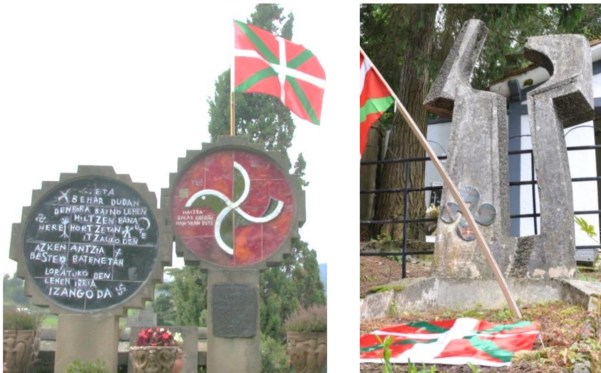
In Zarautz (L) en in Nuarbe (R)

De Basken Juan Paredes Manot, “Txiki” en Angel Otaegi werden dezelfde morgen in andere Spaanse gevangenissen geëxecuteerd. Ze werden nadien begraven in hun eigen stad: