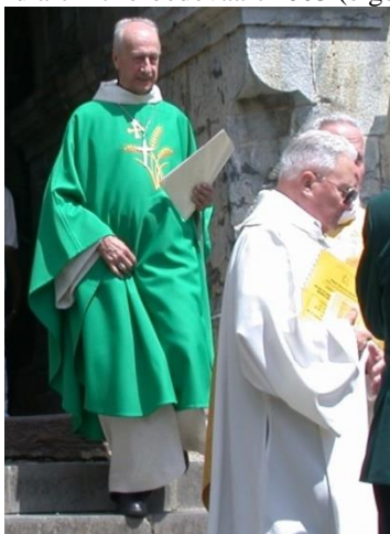
Kardinaal Roger Etchegaray Ezpeleta 2005