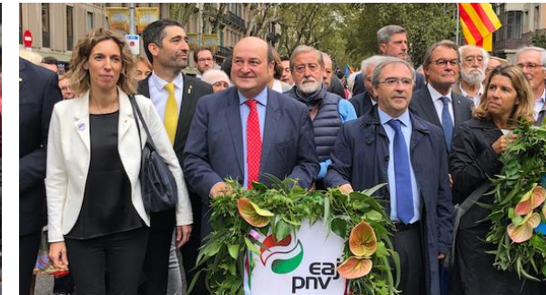
De radicale Basken van Bildu zijn er maar ook de dikke Basken van de PNV