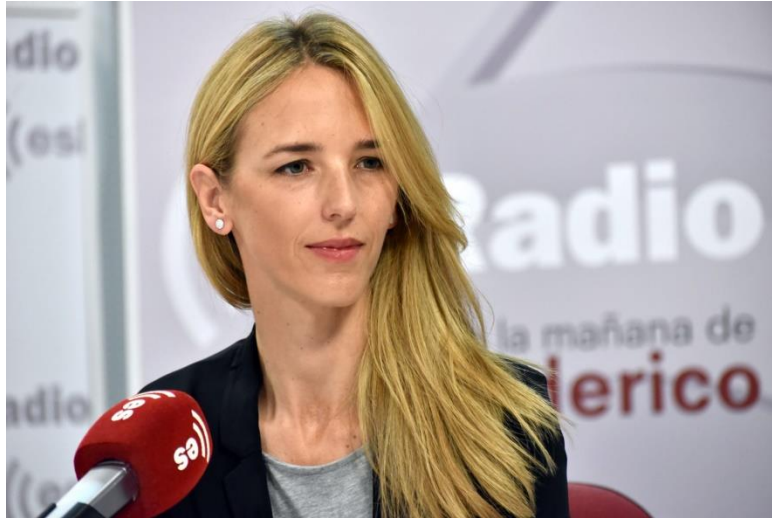
Cayetana Álvarez de Toledo y Peralta-Ramos, Madrid, 15 oktober 1974

De partij heeft ook een nieuwe (nationale) leading lady met een naam waar je overal mee kan komen (behalve in Baskenland):